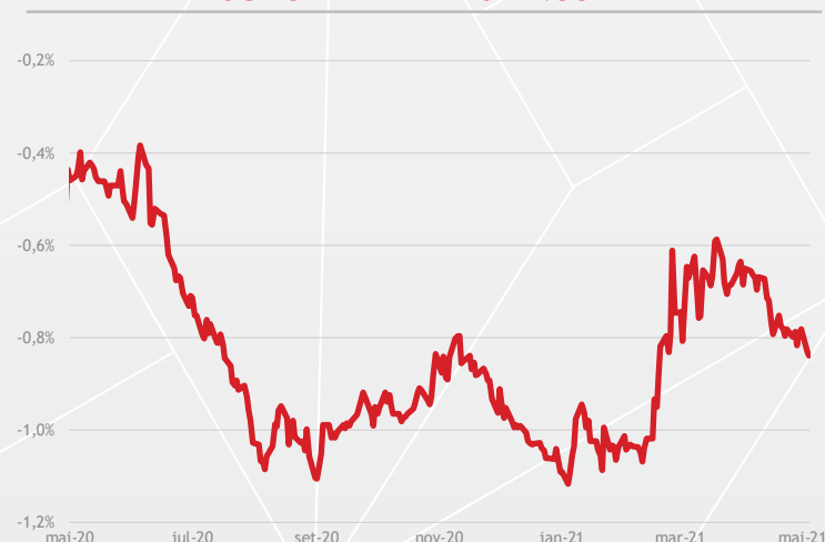
Gráfico 2 | ESTADOS UNIDOS: JURO REAL DE 10 ANOS

Data: 04/2021